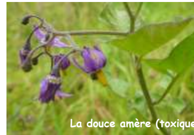
La douce amère (toxique)