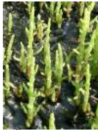
Obione et salicornie

découvrir le site. Possibilité de conjuguer cette sortie avec la dune puis la forêt d'Olonne pour avoir une vision globale du littoral (6,5 km, prévoir la journée).