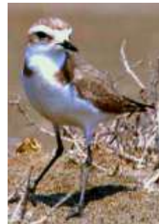
Gravelot à collier interrompu