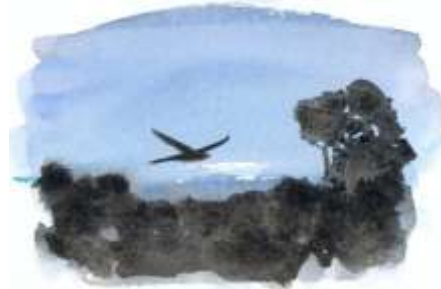
L'engoulevent d'Europe est présent de mai à fin août