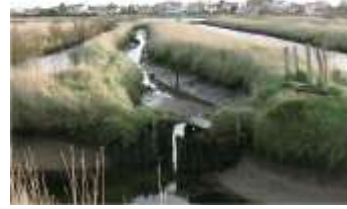
à L'Ile d'Olonne

Thèmes : géomorphologie, gestion du paysage et moyens de protection actuels, faune et flore caractéristiques (répartition, adaptation), activités traditionnelles : pisciculture et saliculture.