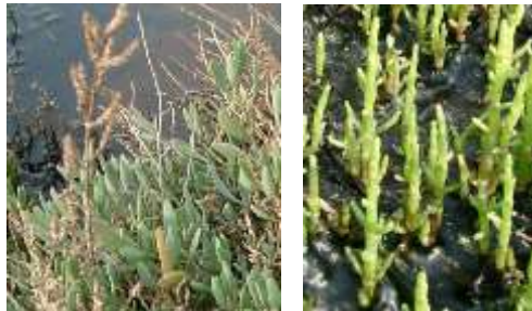
Obione et salicorne