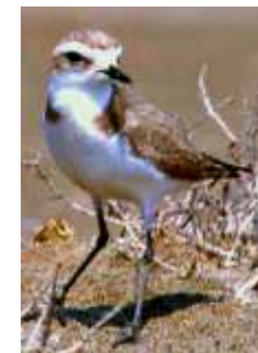
Gravelot à collier interrompu

Thèmes : géomorphologie, laissés de mer, déchets, caractéristique du milieu dunaire, peuplement et répartition des êtres vivants avec adaptations aux conditions de vie, moyens de gestion, comment habiter le littoral ?