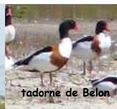
tadorne de Belon